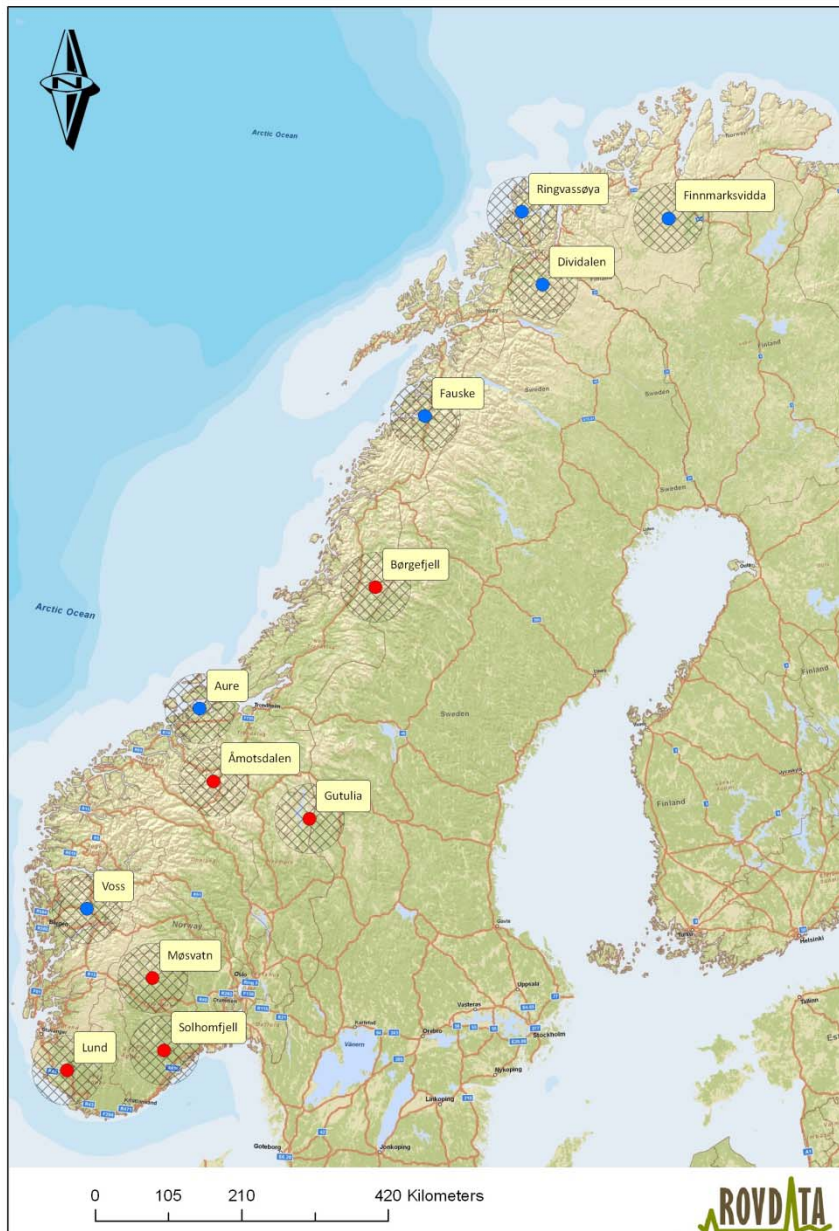
Figur 1. Geografisk lokalisering av de foreslåtte områdene for intensivovervåking av produksjon av unger og overlevelse hos voksenfugl hos kongeørn. Røde punkter viser TOV-områder med etablert overvåking av kongeørn. Det kan bli mindre justeringer i eksakt plassering av områdene i forbindelse med endelig utvelgelse av egnede kongeørnterritorier.

etter de retningslinjer som den nordiske standarden gir. Det vil si at det er brukt tilsvarende metodikk som vi her foreslår for den intensive overvåkingen av kongeørnreproduksjon i det nasjonale overvåkingsprogrammet for rovvilt. Overvåkingen i TOV-regi ble i utgangspunktet etablert for å belyse eventuelle effekter av langtransporterte luftforurensninger. Dette har medført at det utvalg av territorier som da ble gjort var justert for å redusere tilfeldige lokale påvirkninger (les faunakriminalitet/forstyring). Det nasjonale overvåkingsprogrammet for rovvilt har som mål å belyse effekter av all type påvirkning og derfor bør utvalget av kongeørnterritoriene i TOV suppleres, blant annet med territorier som tidligere var ekskludert. Det at det nasjonale overvåkingsprogrammet for rovvilt har som mål også å inkludere mer stokastiske påvirkninger gjør at antall territorier som inkluderes her bør være litt høyere en det som er brukt i TOV (medianantall for de 6 TOV-områdene er 12,5 territorier).